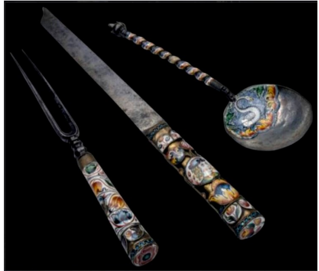
Вилка, нож, ложка. Сольвычегодск. Конец XVII в.

К началу XVIII в., после того как источники соли значительно опреснели ввиду столь масштабной и длительной выработки, торговые пути отошли в сторону, а именитые люди Строгановы стали баронами и перебрались в столицу, основные градообразующие производства пришли в запустение, город стал тихим, уездным. Забота о горожанах полностью легла на городские власти.