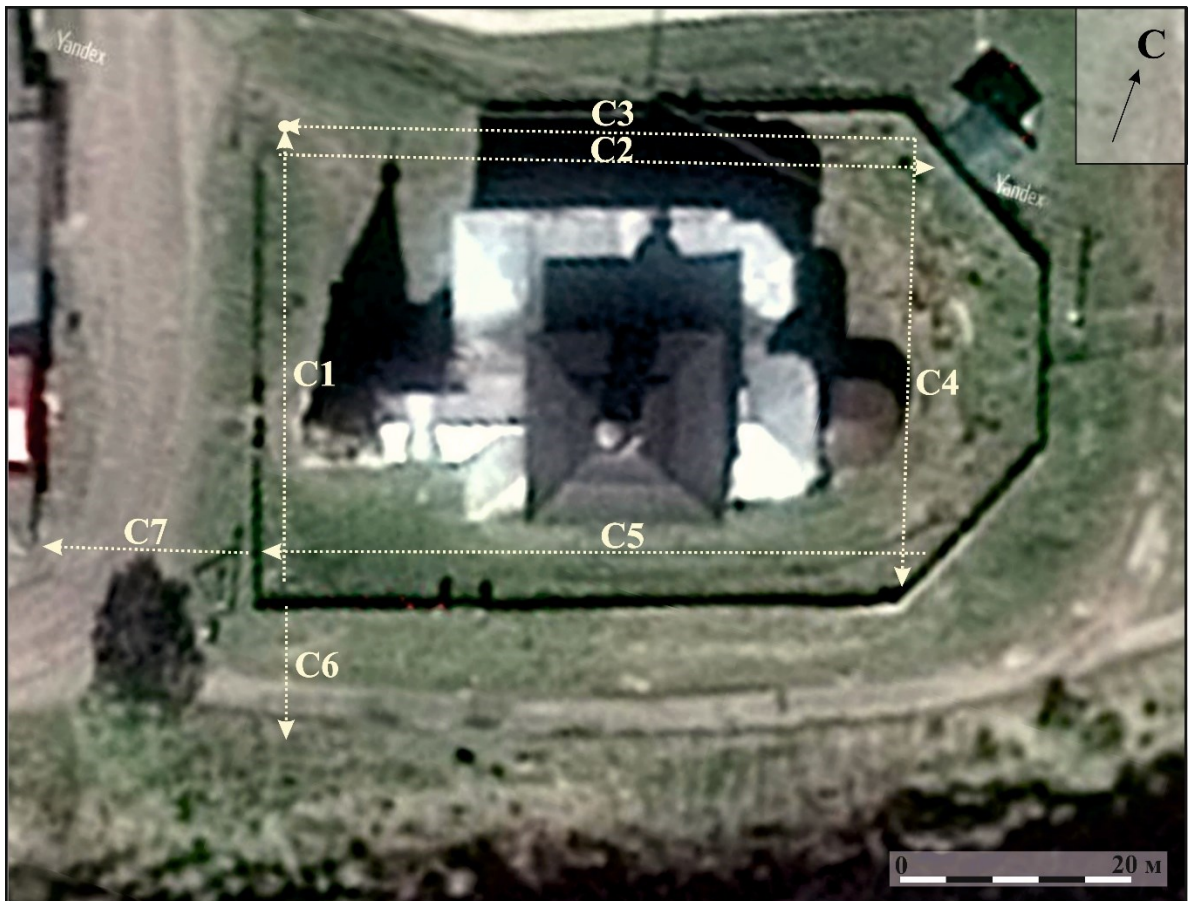
Рис. 6. АЭ САФУ-2018. Архангельская область. Котласский район. Город Сольвычегодск. Спасообыденная церковь. Спутниковый снимок с указанием трасс георадарного сканирования. Профили С1-С7.