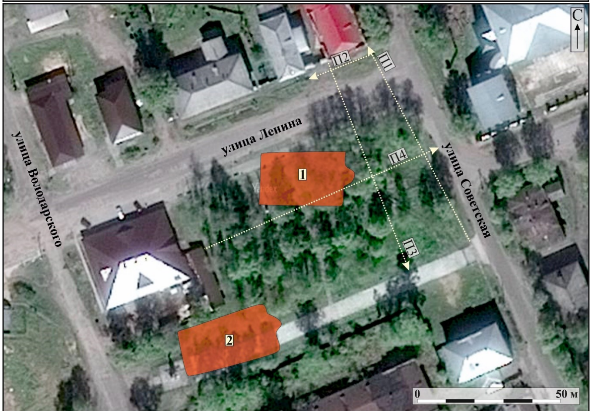
Рис. 7. АЭ САФУ-2018. Архангельская область. Котласский район. Город Сольвычегодск. Спутниковый снимок с указанием расположения трасс георадарного сканирования (П1-П4). Дополнительно на карту наложены цветные абрисы построек на этой территории с карты 1912 г, где: 1 - Крестовоздвиженская церковь (1750 г.); 2 - церковь Воскресения Христова (1747 г.).