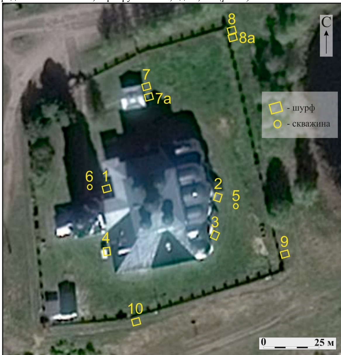
Рис. 3. Благовещенский собор с указанием инженерно-геологических шурфов и скважин, проделанных Институтом по реставрации памятников истории и культуры «СПЕЦПРОЕКТРЕКСТРАВАЦИЯ» в 2002 и 2004 гг.

угольного шлака, строительного мусора с песчаным заполнителем, который определен повсеместно, варьируется от 0,6 до 1,7 м. (рис. 3)