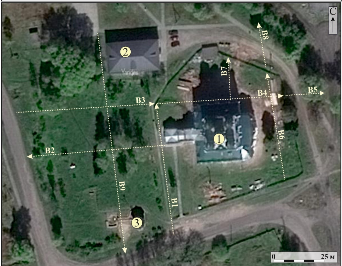
Рис. 5. АЭ САФУ-2018. Архангельская область. Котласский район. Город Сольвычегодск. Спутниковый снимок с указанием трасс георадарного сканирования, где: 1 - Введенский собор; 2 - братский корпус; 3 - башня над источником.