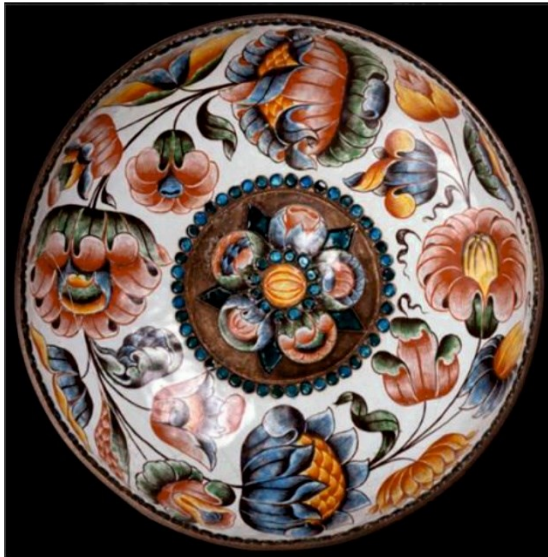
Чаша. Сольвычегодск. 1690-е гг. Максим Буравкин