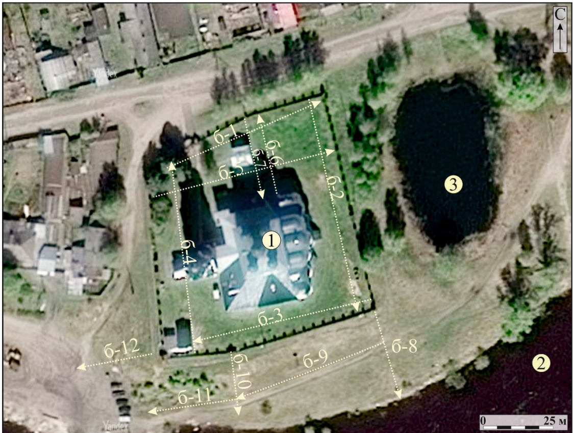
Рис. 4. АЭ САФУ-2018. Архангельская область. Котласский район. Город Сольвычегодск. Благовещенский собор. Спутниковый снимок с указанием трасс георадарного сканирования, где: 1 - Благовещенский собор; 2 - река Вычегда; 3 - озеро Жемчужное.